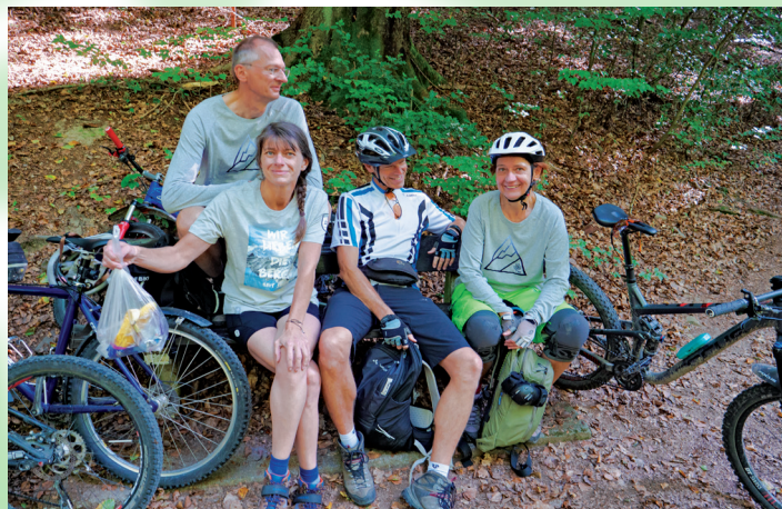
Wir nehmen den Abfall wieder mit