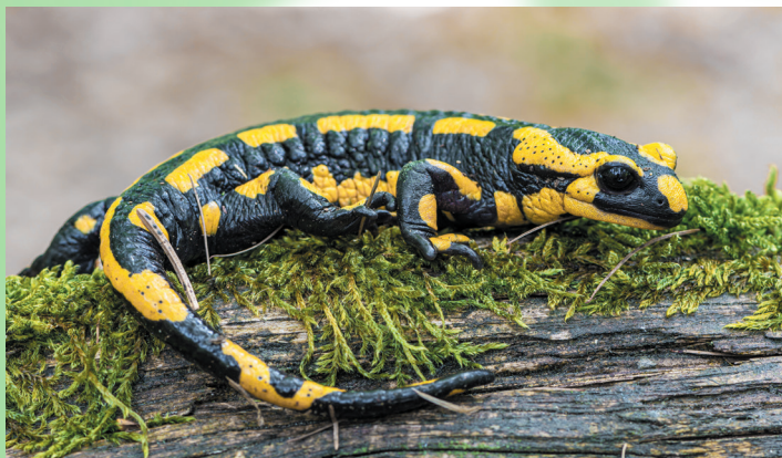
Der Feuersalamander , häufiges Unfallopfer vor allem in der Dämmerung und nach Regen

Die Mountainbike-Gruppen der Sektionen bieten gemeinschaftliche Touren an, auf denen du auch Kontakt zu anderen Mountainbike-Begeisterten knüpfen kannst. Sicher haben wir auch in deiner Gegend ein interessantes Angebot für dich!