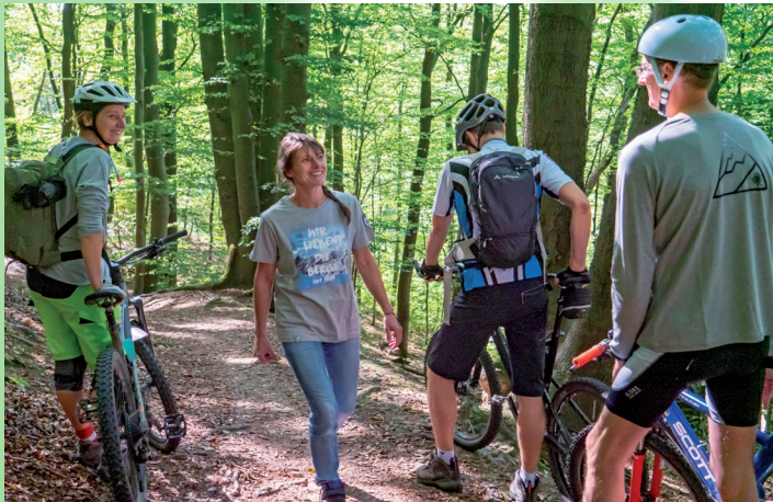
Wir gewähren Wanderern Vorrang