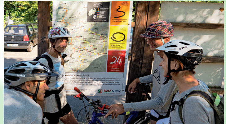
Wir informieren uns über das Wegenetz