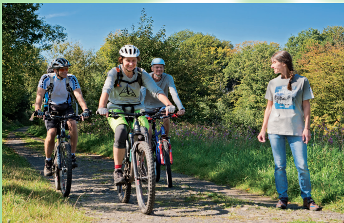
In einer MTB-Gruppe machen Touren Spaß!

Im Landesverband Nordrhein-Westfalen des Deutschen Alpenvereins (DAV) bieten viele Sektionen Mountainbike-Gruppen an. Der DAV ist nicht nur ein Bergsportverband, sondern setzt sich als anerkannter Naturschutzver